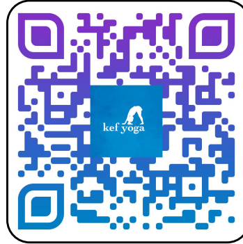
Las Ovejas y El Lobo https://youtu.be/ttuii1VyYxA