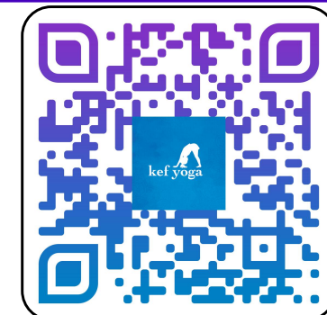
La Hormiga Astronauta https://youtu.be/_EaQOnpFBhU