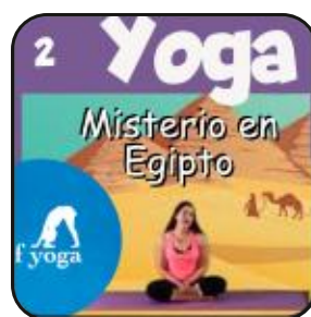
Misterio en Egipto