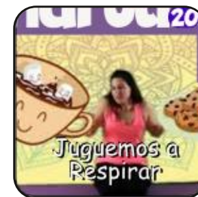
Juguemos a respirar