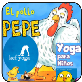
El pollo Pepe