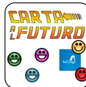
Carta al futuro