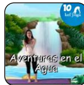
Aventuras en el Agua