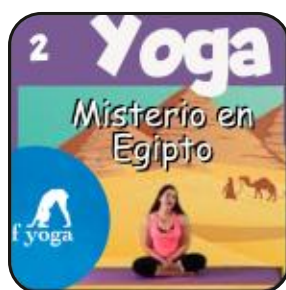
Misterio en Egipto