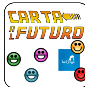
Carta al futuro