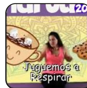
Juguemos a respirar