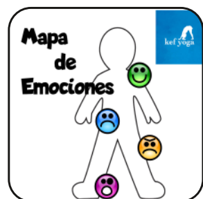
Mapa de Emociones