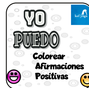
Colorear Afirmaciones positivas https://www.kefyoga.com/afirmaciones