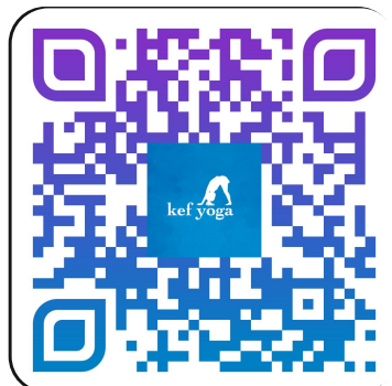
Caballitos de Mar https://youtu.be/JPUa7WJZuk4