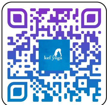
El árbol que no daba frutas https://youtu.be/5ubhCd9OcrI