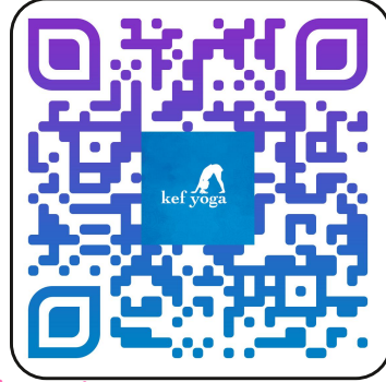
Las Ovejas y El Lobo https://youtu.be/ttuii1VyxA