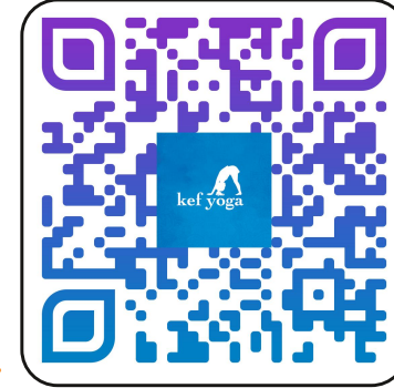
Juego del calentamiento https://youtu.be//LLk6lfKPGCU